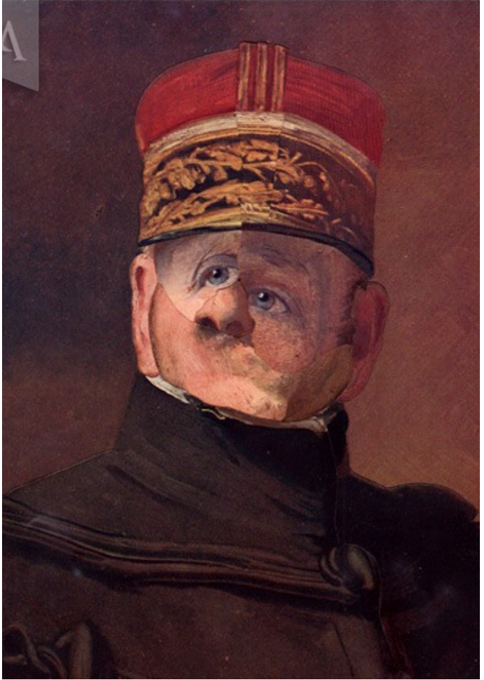
Gueule cassée n° 71