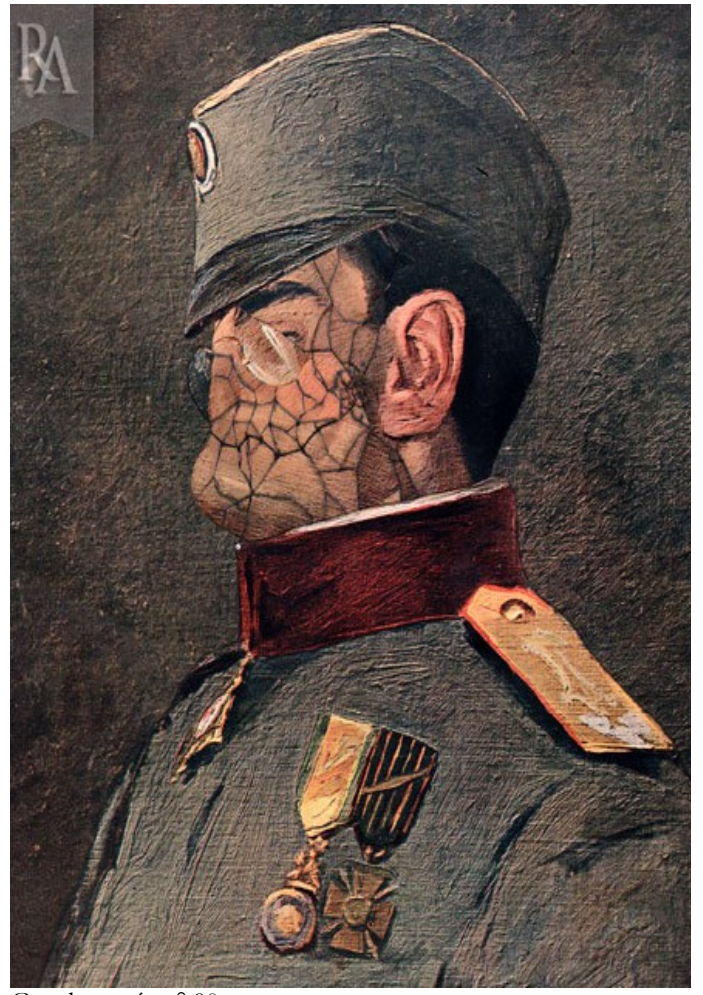
Gueule cassée n° 90