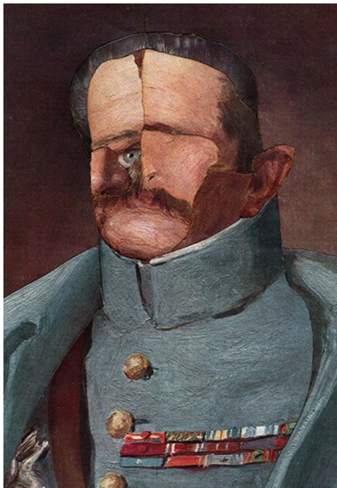
Gueule cassée n° 139, par René Apallec.