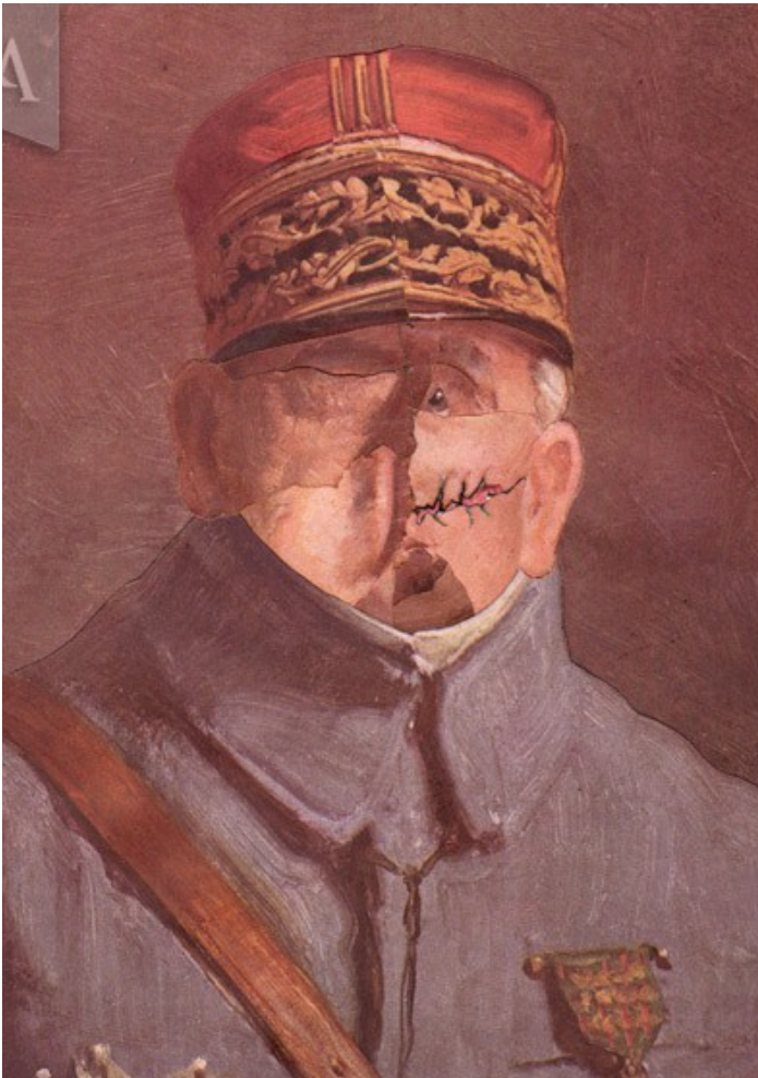
Gueule cassée n° 75