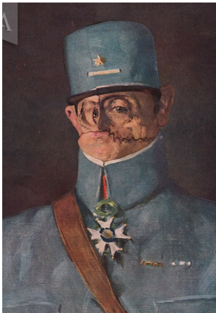
Gueule cassée n° 69 (R.A.)