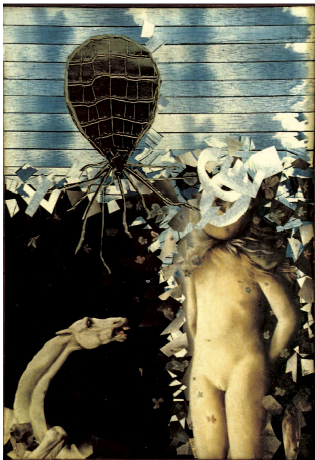
Collage, Tension suave de la montgolfière In Sextant , 1985.

À paraître septembre 2013 Aux Éditions Le Pauvre songe c/o Christian Ducos, 13 rue Saint-Joseph, 33400 Talence (France) lepauvresonge@hotmail.fr www.lepauvresonge.com