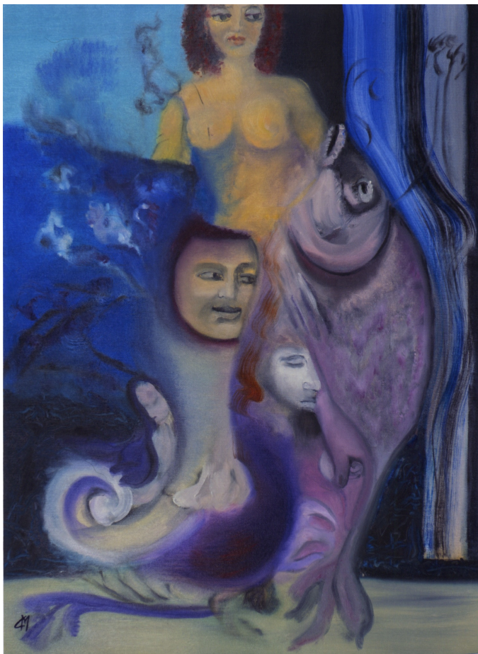
Mireille Cangardel expose à Seix jusqu'au 27 août

Derrière l'obscurité il y a des visages qui m'ont abandonné. J'ai vu leur peau ravagée d'éclairs, à présent je ne vois plus, dans l'instant jaune, que la lueur de leurs lointaines paupières.