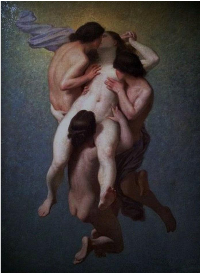
Octave Tassaert Merci Lola !

Extrait de La Fille de l'air in Une brève, une longue ! Éditions Le Grand Tamanoir, 2017